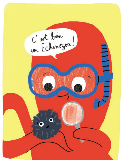
Naturaliste & Écologiste