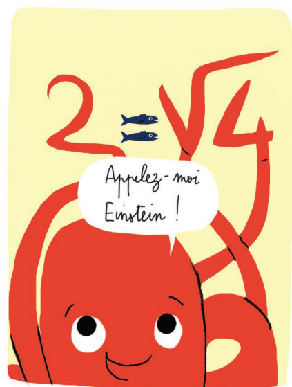
Mathématique & Logique