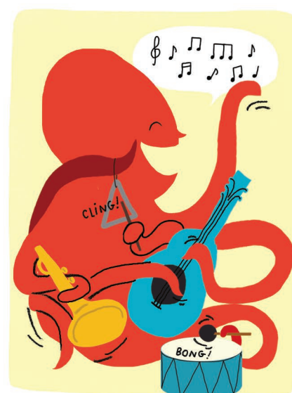
Musicale & Rythmique