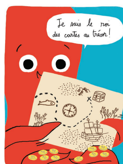
Visuelle & Spatiale