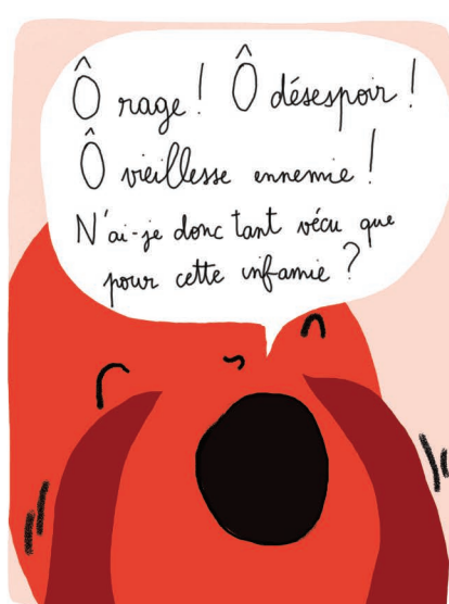
Verbale & Linguistique