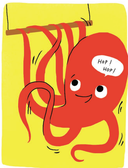
Corporelle & Kinesthésique